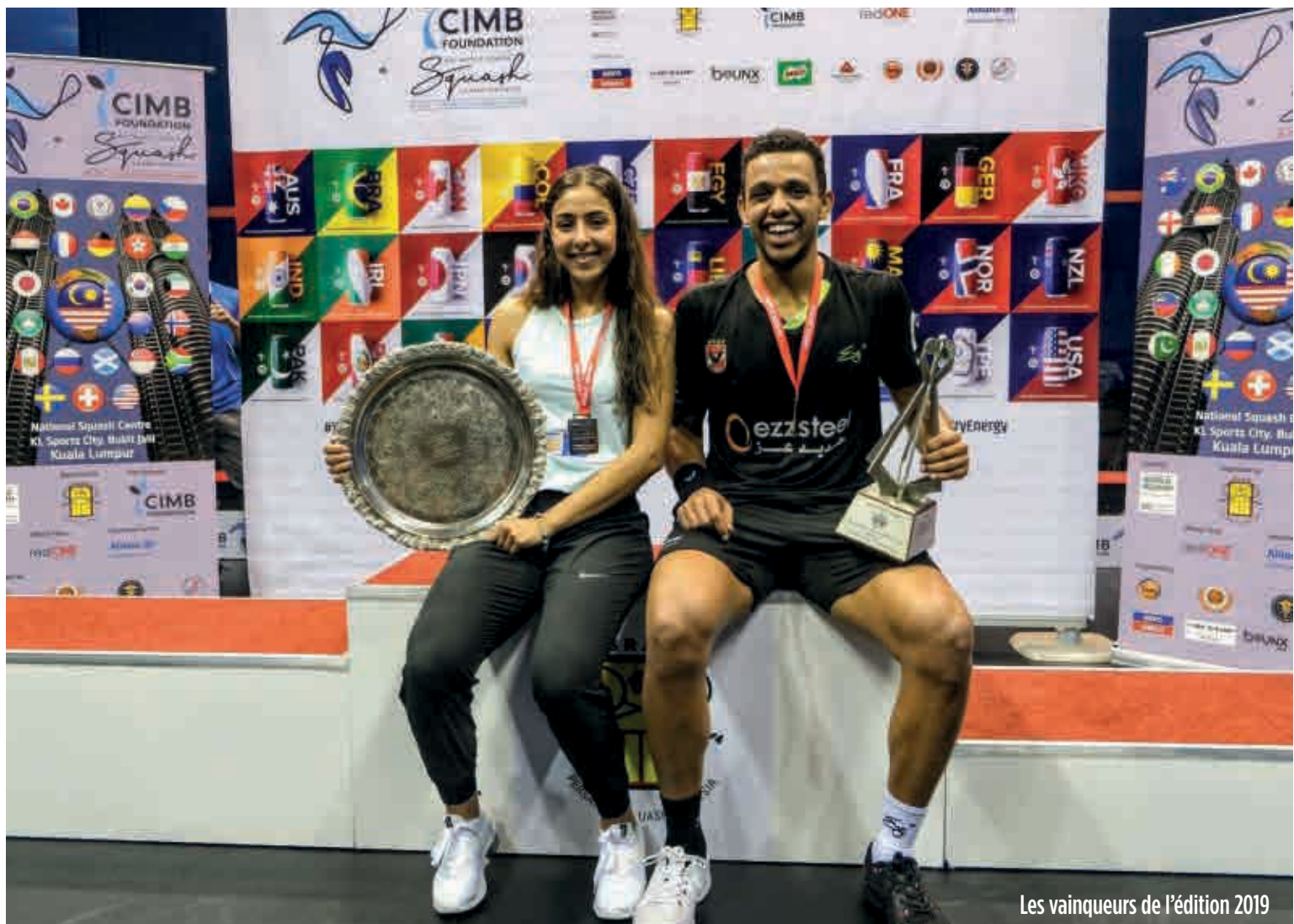
Les vainqueurs de l'édition 2019

Pour finir, un clin d'œil rempli de sens : la présence de sportifs ukrainiens. Après plusieurs sollicitations pour financer et organiser leur venue, la délégation ukrainienne de squash arborera la place d'invitée d'honneur. Plusieurs compétiteurs juniors prendront donc place pour se surpasser et rafler la victoire. Une manière de montrer, encore et toujours, que le sport tisse aussi bien des liens qu'il diffuse des valeurs universelles. Rendez-vous du 11 au 21 août 2022 !