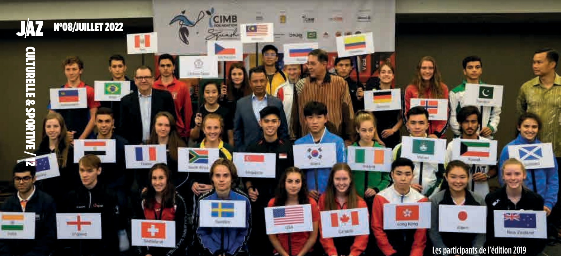
Les participants de l'édition 2019